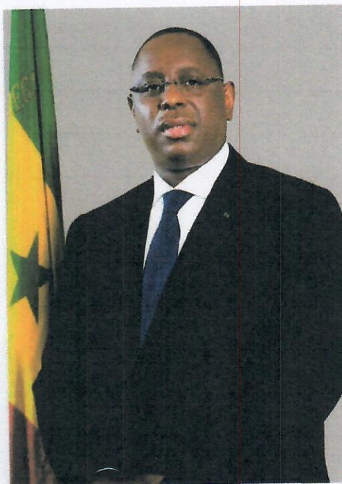
His Excellency Macky SALL, President of the Republic of Senegal

For companies and business people looking for a competitive location in Africa, Senegal is a response to their expectations. A competitive edge epitomized by our exemplary political and social stability, a productive workforce, and cutting-edge logistics. The country also offers a pool of raw materials, a market with exponential demographic prospects.